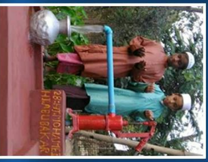
Arakan, Myanmar Bantuan Wakaf Telaga Air